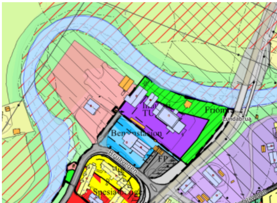
Fig. 2 viser gjeldende planstatus i området.

Hensikten med planforslaget er å utvide eksisterende industriområde på Lundamo i Melhus kommune. Detaljreguleringen skal tilrettelegge for nye arealer for industrivirksomhet, og rydde opp i uoverensstemmelser mellom gjeldende planer for området, og bruken av området. Planavgrensningen omfatter eiendommene gbnr.208/2, 208/183 og 208/184. Det reguleres inn et område langs Lundesokna til friluftformål (LF) for å ivareta Lundesokna og kantskogen langs elva. Området har også fått en hensynssone 320 flomsone, som skal sikre bebyggelsen mot flom gjennom bestemmelse. Ellers får området planformålene offentlig eller privat tjenesteyting (område for allerede etablert brannstasjonen), bensinstasjon/vegservice (Cirkel K's allerede etablerte område), industri/lager og et lite areal med annen veggrunn/grøntareal.